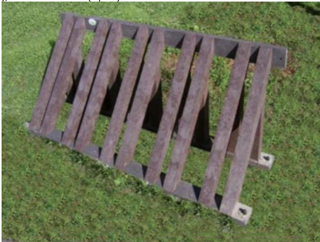
Art. 5.14.5 BACHECA

Elementi di arredo in plastica riciclata ,Portabici modulare interamente realizzato in plastica riciclata al 100%, composto da una struttura portante realizzata con profilati di sezione quadrata cm 7 x 7 quali profili di supporto alla ruota della bicicletta e profilati di sezione rettangolare 10 x 3 cm per un facile ancoraggio a terra. Sistemi di fissaggio in acciaio zincato a caldo. Dimensioni: 105 x 60 x 60 h cm (3 posti); 140 x 60 x 60 h cm (4 posti); 175 x 60 x 60 h cm (5 posti)