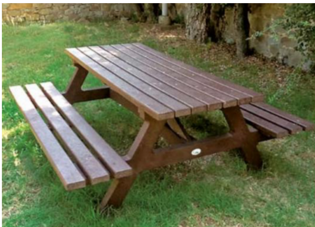
Art. 5.14.3 CESTINO PORTARIFIUTI

Il tavolo e le panche sono collegate tra loro con n°2 profilati sezione quadra 7 x 7 cm Sistemi di fissaggio in acciaio zincato a caldo. Dimensioni: 180 x 210 x 77 cm (L x A x H)