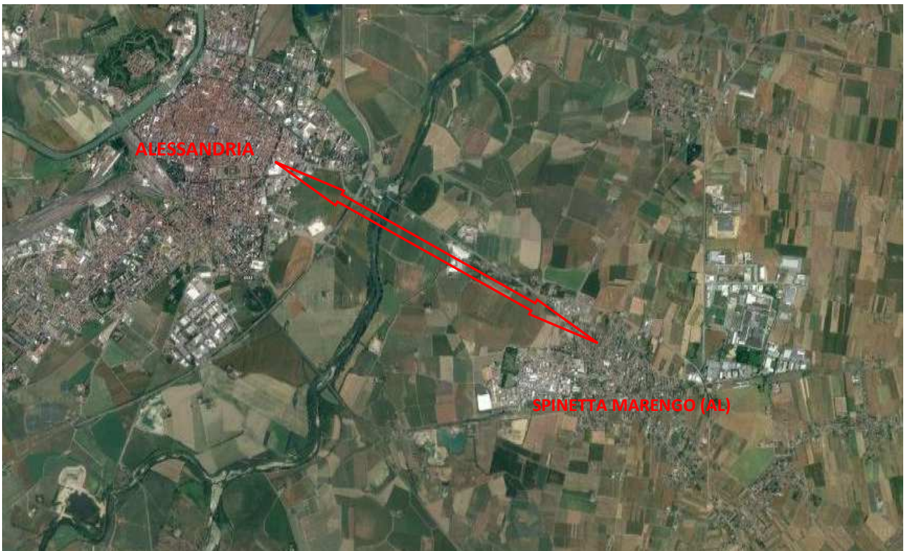
Estratto - Aerofoto