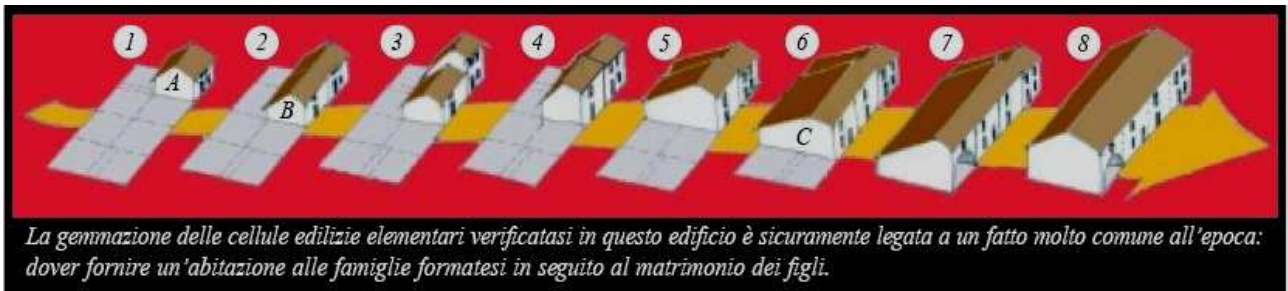
Fabbricato in pisé a Mandrogne (Fraz. Galade). Sviluppo volumetrico dell'edificio.

Basti pensare agli scavi etruschi, dove a lungo gli archeologi spalarono della gran terra alla ricerca degli edifici per poi finalmente intuire che tutta quell'argilla altro non era che la muratura delle case! Infatti gli Etruschi abitavano all'interno di capanne a pianta ovale o rettangolare, costruite con mattoni crudi, il tetto spiovente di paglia con l'intelaiatura in legno. I materiali con cui erano costruite le case del popolo non erano molto diversi da quelli utilizzati per le case dei nobili... Questo tipo di abitazione fu successivamente ripreso anche dai Romani. Così dovevano apparire le prime abitazioni del popolo Marico di Frascheta.