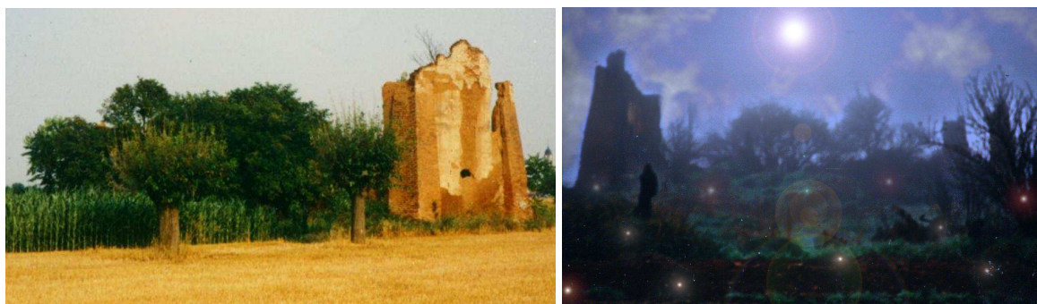
Ruderi della Cascina denominata "del vino" nei pressi di Mandrogne. Oggi dopo più di mezzo secolo d'incuria è completamente scomparsa. Le costruzioni in crudo, per incuria, si dissolvono lentamente, ospitando sempre al loro interno alberi e arbusti e navigando come un vascello fantasma tra le nebbie della Frascheta. Il risultato finale è fortemente pittoresco e romantico. La Natura si riprende ciò che l'Uomo le ha sottratto...

Non è facile determinare la vita media di un edificio costruito in crudo: condizioni climatiche, uso costante o abbandono, degradi legati all'azione degli agenti meteorologici, dissesti dovuti a cedimenti del terreno, danni legati a fattori particolari come terremoti, alluvioni, incendi e addirittura saccheggi; sono tutti fattori che influiscono in modo determinante. Se però si considera il crudo come uno dei tanti materiali da costruzione, si può constatare come la vita media degli edifici con murature realizzate con questo materiale, a parità di «affronti» subiti, non è certo più breve di quella di entità architettoniche fatte di qualsiasi altro materiale e si può tranquillamente stimare nell'ordine di duecento anni. Vi sono edifici che, tra una trasformazione e l'altra, inglobano nella loro cubatura intere pareti che perdurano quindi per lunghissimo tempo all'insaputa degli stessi abitanti che si susseguono durante i secoli di vita dell'edificio. L'unica vera differenza consiste nelle rovine delle costruzioni; infatti una costruzione di materiali tradizionali offre quasi sempre uno spettacolo di rovine identificabili, mentre una costruzione in crudo si dissolve lentamente, rendendo impossibile ogni identificazione delle forme originarie.