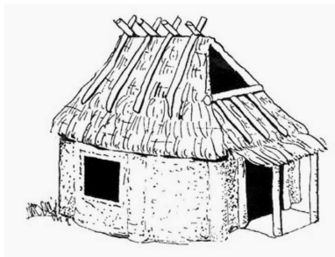
Capanna etrusca (da: I segreti degli etruschi, Ente Regionale Parco di Veio).

Basti pensare agli scavi etruschi, dove a lungo gli archeologi spalarono della gran terra alla ricerca degli edifici per poi finalmente intuire che tutta quell'argilla altro non era che la muratura delle case! Infatti gli Etruschi abitavano all'interno di capanne a pianta ovale o rettangolare, costruite con mattoni crudi, il tetto spiovente di paglia con l'intelaiatura in legno. I materiali con cui erano costruite le case del popolo non erano molto diversi da quelli utilizzati per le case dei nobili... Questo tipo di abitazione fu successivamente ripreso anche dai Romani. Così dovevano apparire le prime abitazioni del popolo Marico di Frascheta.