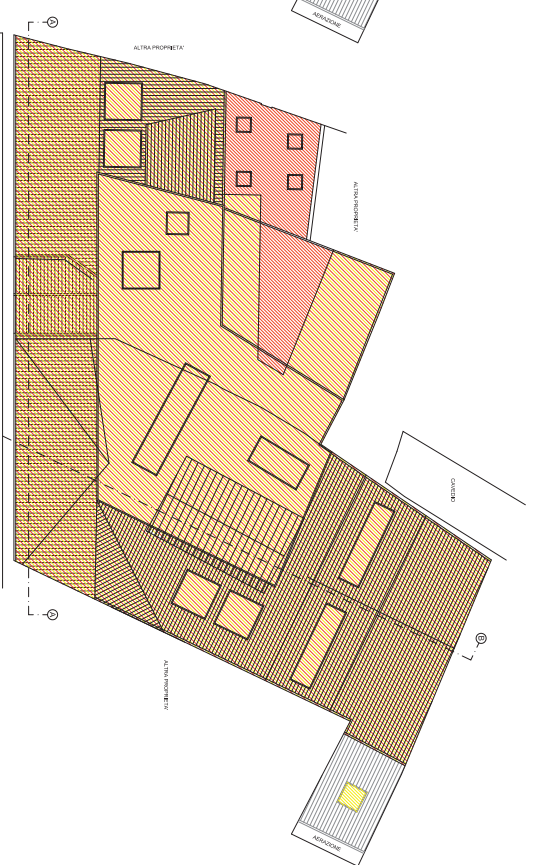
PIANTA COPERTURA 2° LIVELLO