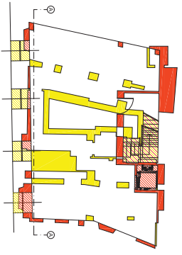
PIANTA PIANO INTERATO