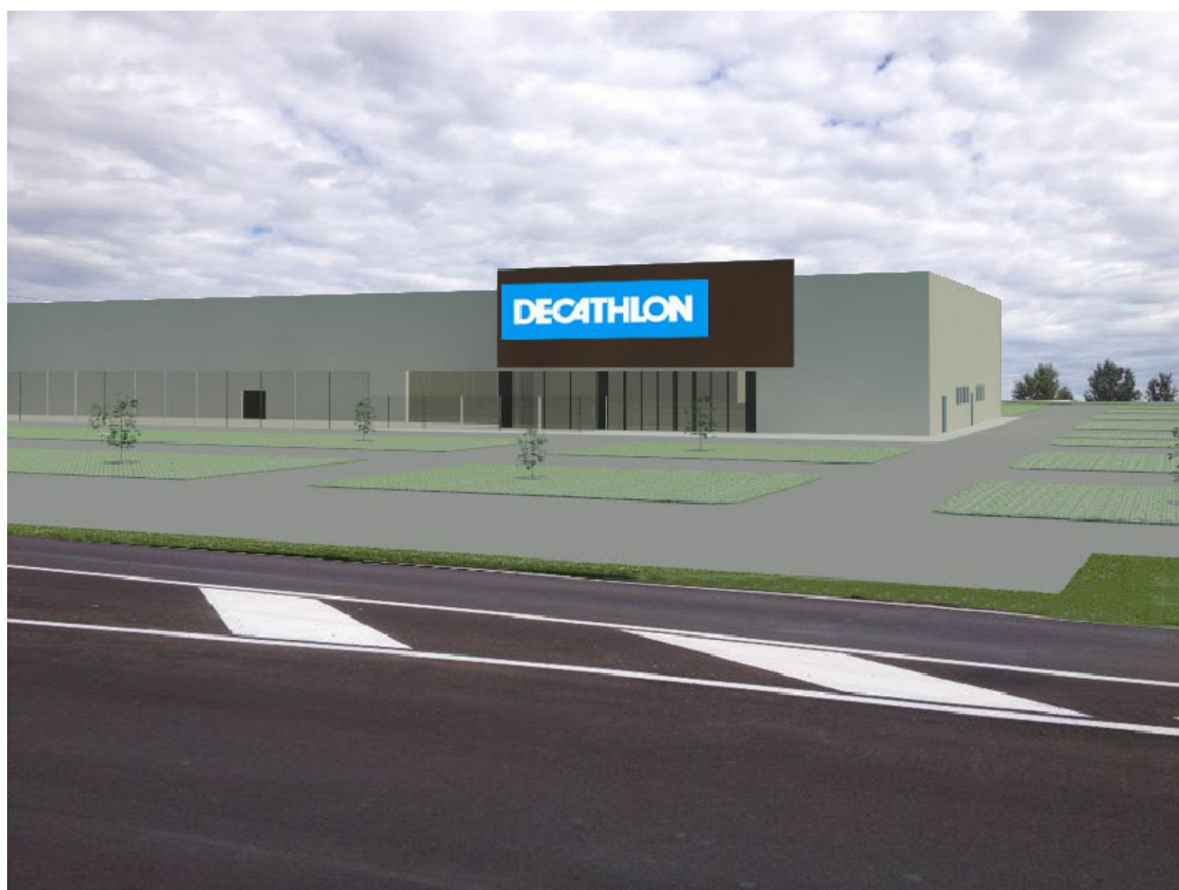
PUNTO DI VISTA 4