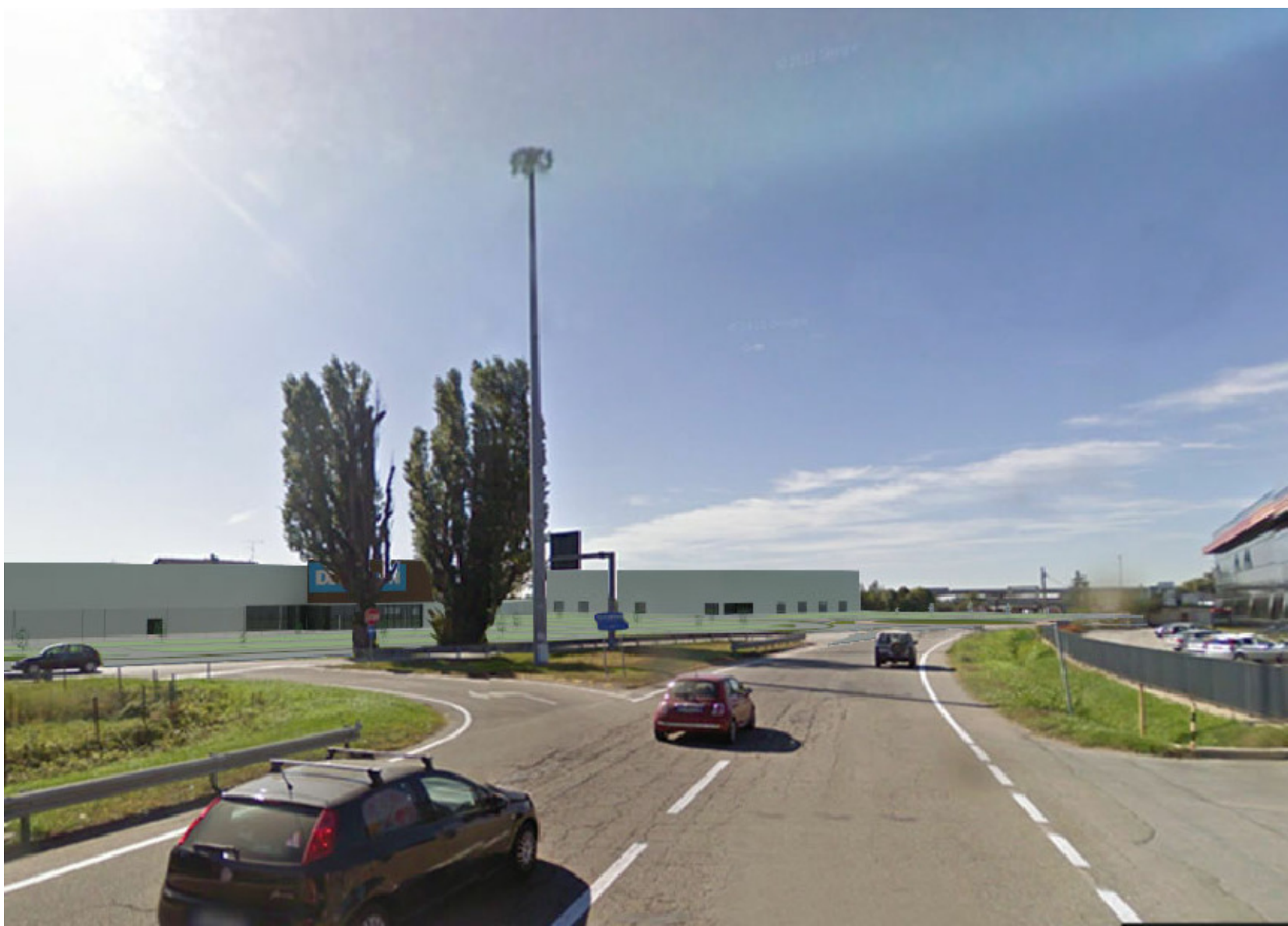
PUNTO DI VISTA 2