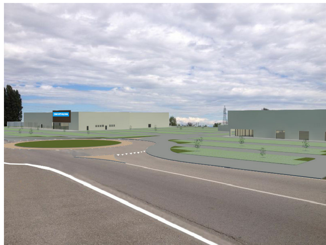
PUNTO DI VISTA 3