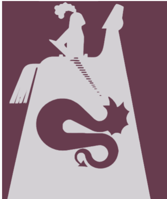
Logo esemplificativo, tratto dall'edizione del 1975

La fiera di San Giorgio è una manifestazione identitaria che conta oltre 400 edizioni, profondamente radicata nella tradizione della città. Da fiera agricola si è trasformata in mostra campionaria fino ad una lenta ma costante sparizione dalla vita della città.