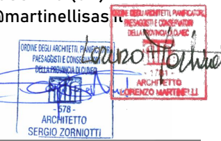
TAVOLA N°: SCALA: unica 1:500